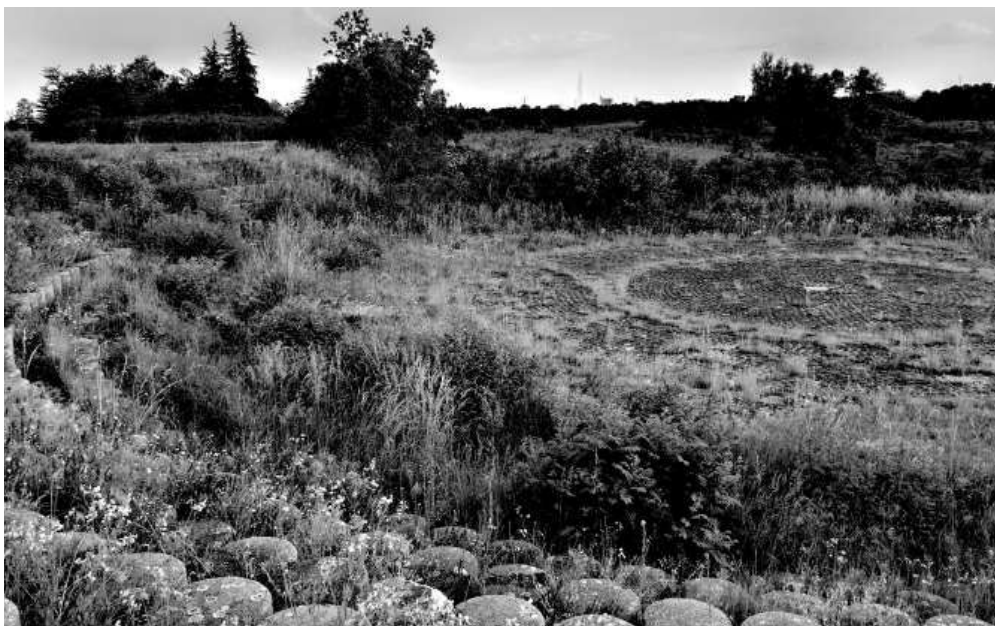
Слика 6: Трећа композициона целина – амфитеатар

Међутим, судбине хиљада жртава страдалих на овом месту нас обавезују да, као појединци и као друштво, даљим унапређивањем изгледа овог меморијала, унапређујемо културу сећања на њих. Полазна тачка за тај подухват свакако се може наћи у претходно наведеном списку мера заштите у оквиру Одлуке у утврђивању, односно у појединачним мерама које се не поштују у довољној мери, а не изискују велика материјална средства. Препорука надлежним институцијама јесте да, настављајући добру и сваке хвале достојну праксу одржавања „Стратишта“, посебну пажњу у наредном периоду посвете партерном и хортикултурном уређењу заштићене околине спомен-комплекса, постављању урбаног и комуналног мобилијара, као и адекватног и пространог паркинга, свакако, са друге стране пута Панчево–Јабука. Напоследку, као важну препоруку треба истаћи најхитнију реализацију уклањања растиња које нарушава целокупан изглед треће целине споменичке композиције, односно амфитеатра. Ова занемарена целина налази се ниже од остатка спомен-комплекса, те њена запуштеност није уочљива док јој се не приступи.