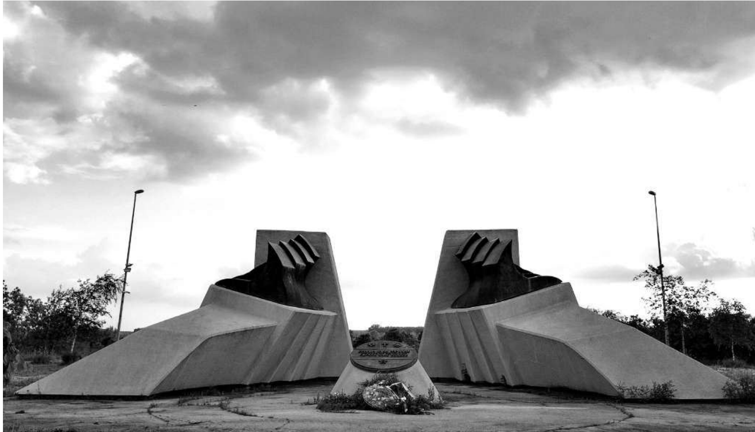
Слика 2: Спомен-комплекс „Стратиште“, фронтални изглед

Овај четрдесет две године стар спомен-парк простира се на површини од 28.200 m 2 , док окружење споменика обухвата 1.700 m 2 . Површина самог комплекса груписана је у пет катастарских парцела катастарске општине Јабука (бр. 1863/2, 1864/3, 1865/2, 1865/9 и 6248/3 КО Јабука), док заштићена околина обухвата знатно шири простор који обухвата пет целокупних катастарских парцела (1863/2, 1864/3, 1865/2, 1865/9 и 6248/3 КО Јабука) и део једне катастарске парцеле (бр 1863/1 КО Јабука). 18