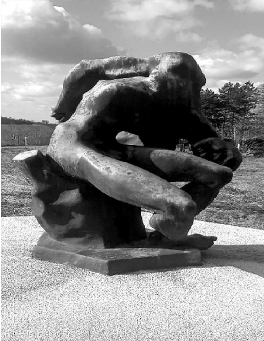
Слика 1: Споменик стрељаним родољубима на путу Панчево–Београд