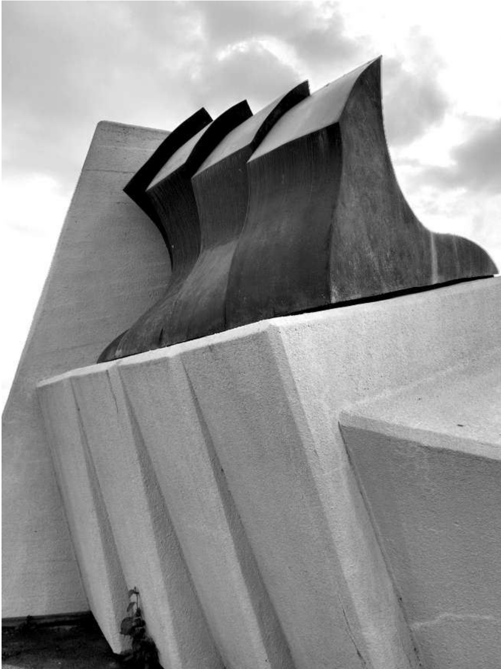
Слика 5: Споменик „Бразде“, бочни изглед

шриљца димензија 10/10/2 cm у оквиру прилазне стазе, приступног и манифестационог платоа, белог кулијеа за изградњу приступног платоа, док су кондолит и бронза основни материјали од којих је израђен сам споменик. 19 Споменик је забетониран у земљи на дубини од 1,5 метар, слојем бетона од 110 cm, изнад којег је слој армираног бетона дебљине 40 cm. Дебљина бронзе од које је споменик израђен је 20 cm. 20