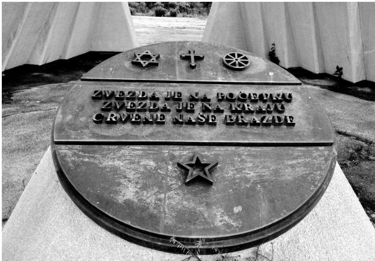
Слика 4: Место за полагање венаца

Смештен на наведеном пространству, спомен-комплекс „Стратиште“ може се поделити на три целине. На предњој, прилазној страни, налази се приступни плато у оквиру којег се налази место одређено за полагање венаца у облику зарубљеног ваљка. На ваљку се налазе у бронзи изливени симболи страдалих (Давидова звезда, крст, точак и звезда петокрака), испод којих се налазе стихови Васка Попе: „Звезда је на почетку / Звезда је на крају / Црвене наше бразде“.